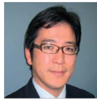
後 信 公益財団法人 日本医療機能評価機構 執行理事