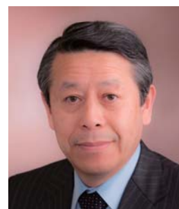
日本病院会会長 相澤 孝夫