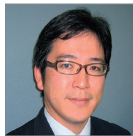
後 信 公益財団法人 日本医療機能評価機構 執行理事