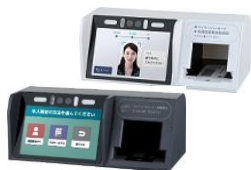
株式会社アルメックス