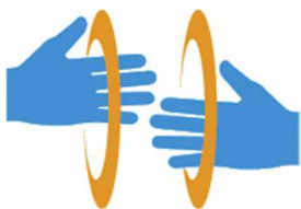
【手話マーク】 所管：一般財団法人全日本ろうあ連盟