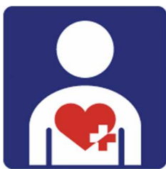
【ハート・プラスマーク】 所管：特定非営利活動法人 ハート・プラスの会