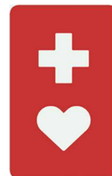
【ヘルプマーク】 所管：東京都