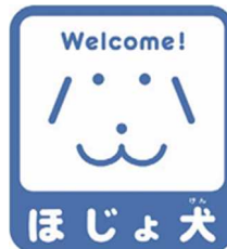
【ほじょ犬マーク】 所管：厚生労働省