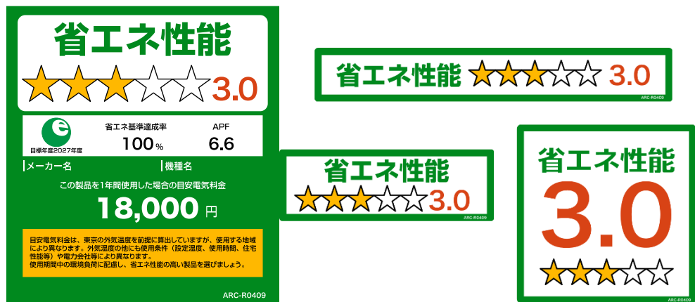
(家庭用エアコンディショナーのイメージ)