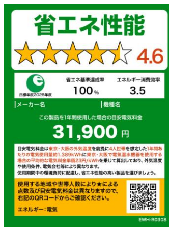
(電気温水機器のイメージ)

※温水機器以外は、製品のサイズやネット取引等の限られたスペースで使用する場合は右側のミニラベルを活用すること。