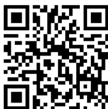
アンケート調査フォーム QR コード